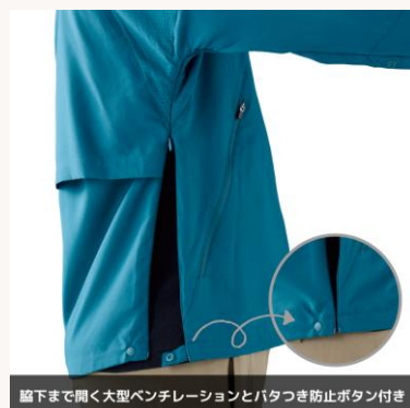
膝下まで開く大型ベンチレーションとボタン付き

まとめると、このパーカーは「真夏用のメイン服」というより、訪問現場での体温調整を助けてくれる実用ウェア。忙しく動き回るケアマネジャーさんや訪問看護師さんにとって、1枚持つておくだけでも地味に助かる存在だと思います。